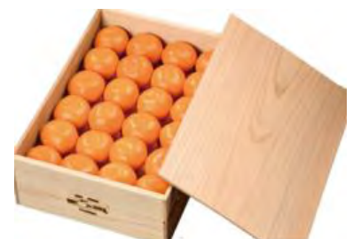
林さんの田村みかん

このほかにも、お魚やハム、コーヒー、お酒といった定番のギフトから帰省の手土産やご自宅用にもお使いいただけるスイーツのギフトなど幅広く取り扱っております。