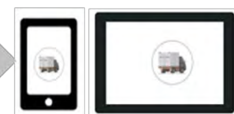
車両位置情報を活用した移動販売サポートシステム (G-Fleet/トヨタコネクティッド社)