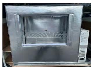
可搬式冷凍冷蔵機 (D-mobico/デンソー社) ※保冷ボックスはクラックス社となります